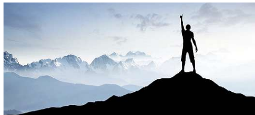
Das diesjährige Firmotto «Gepfustörmer»