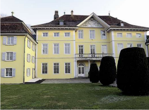
Text: Patricia Lustenberger